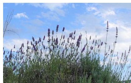
5階屋上庭園のラベンダー

5階の屋上庭園には開設時から植えられているラベンダーが、元気に咲き始めています。そこにはミツバチが毎年遊びに来てくれます。見るだけじゃなく、素敵な香りも楽しんでいます。暑い日がつづきます！水分補給に注意してまいります。